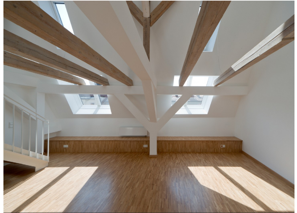
DG links