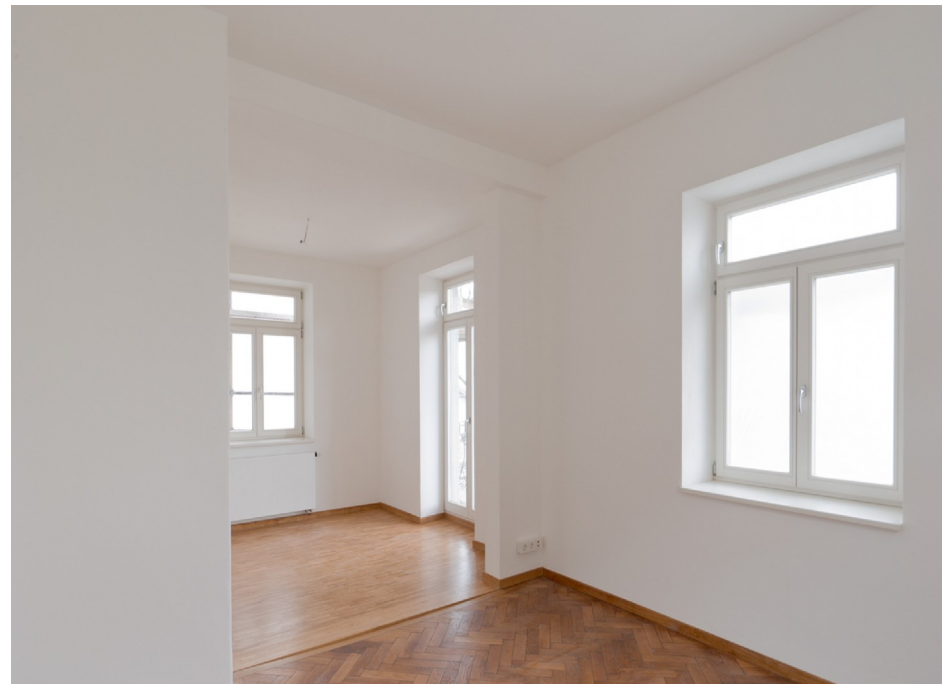
3 OG links