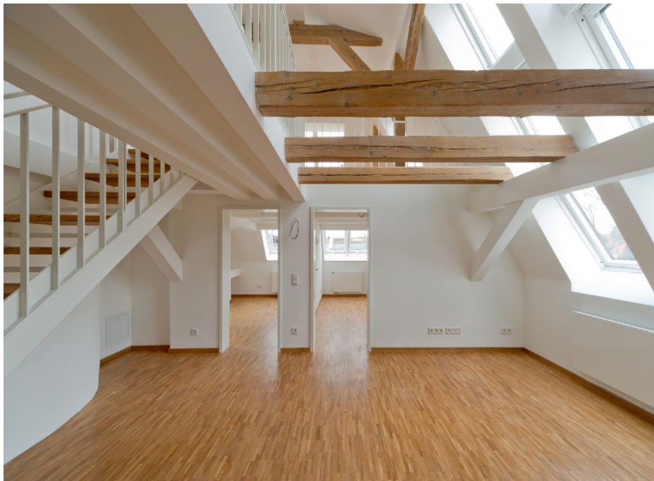
DG rechts